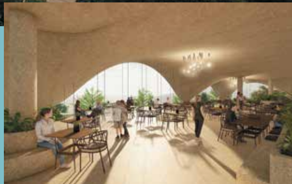
> Restaurant vue mer

Notre écolodge comme nos villas bioclimatiques sont conçues par Nomadic Resorts. L'équipe partage la vision d'une architecture simple et épurée, respectueuse de l'environnement. Elle a donc imaginé des structures parfaitement intégrées dans la nature et travaille à préserver la faune et la flore. Nomadic Resorts est connu pour concevoir des projets qui ne nuisent pas à la biodiversité afin de relier les occupants des lieux à la nature.