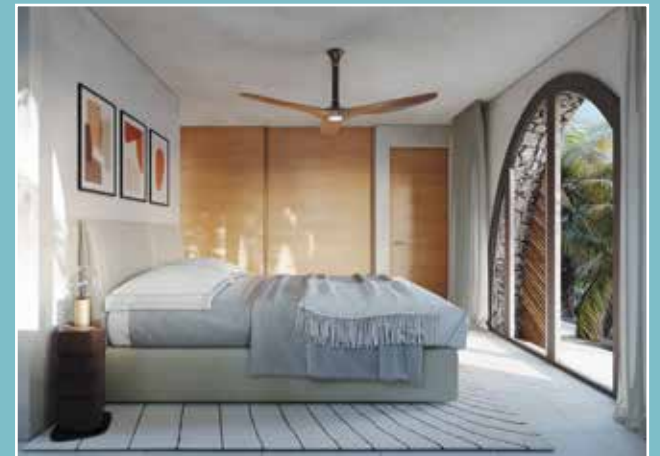
Intérieur d'une Rivulet meublé et décoré par Roche Bobois