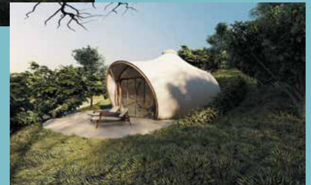
> Cocon privé de luxe

L'écolodge Nomadic Anbalaba offrira 20 cocons privés de luxe . Sans vis-à-vis, chaque lodge aura une vue sur le lagon turquoise.